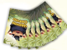
Подготовка к игре для трёх игроков