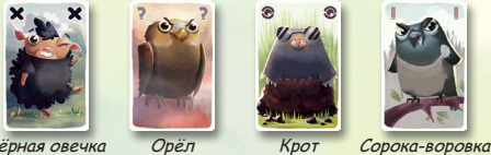
Чёрная овечка Орёл Крот Сорока-воровка