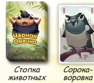
Сопка животных Сорока-воровка