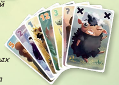
5 карточек обычных животных +1 Чёрная овечка +1 особое животное